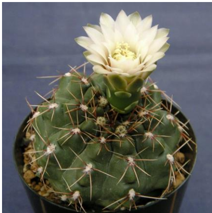
G. gaponii B 42 (Piltz seed 1019)