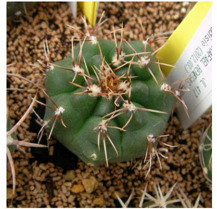
G. gaponii JL 417 Villa Rafael Benegas, Cordoba, Arg. (ex)-Milenaudisio