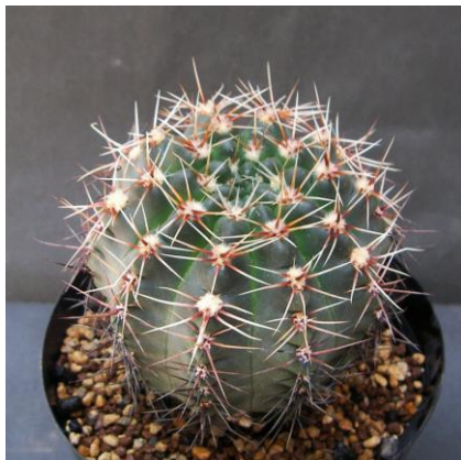
G. genseri (Koehres seed 2055)