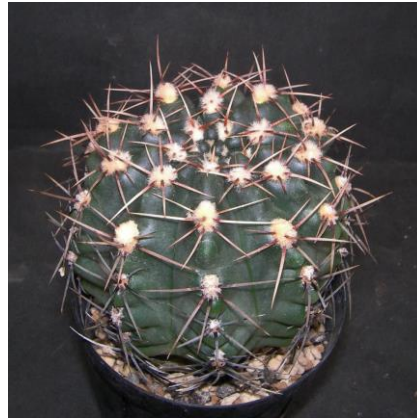
G. gaponii B 42 (Piltz seed 1019)