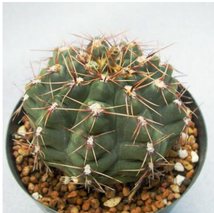
G. gaponii B 42 (Piltz seed 1019)