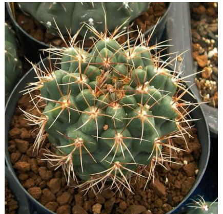
G. gaponii B 42 (Piltz seed 1019)