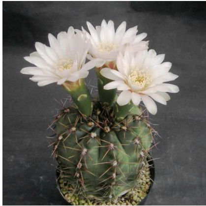
G. gaponii B 42 (Piltz seed 1019)