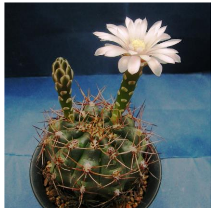
G. genseri (Mesa seed 464.9)