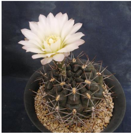
G. gibbosum v. nigrum Sa Lihuel Calel, La Pampa, Arg. (Piltz seed 0858)

Synonyms : ≙ G. gibbosum ssp. gibbosum [G. Charles] : ( 九紋竜 ) (異名同種) ≙ G. gibbosum v. nigrum : ( ニグラム )