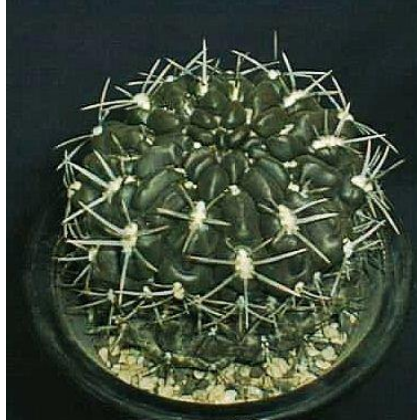
G. gibbosum v. nigrum (ニグラム)