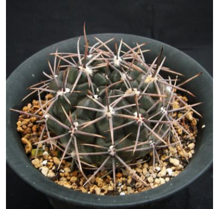
G. gibbosum v. nigrum Sa Lihuel Calel, La Pampa, Arg. (Piltz seed 0858)