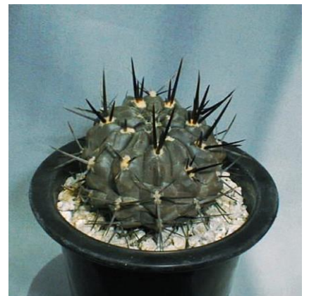
G. gibbosum v. nigrum (ニグラム)