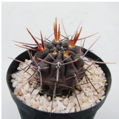
G. gibbosum v. nigrum (ニグラム)