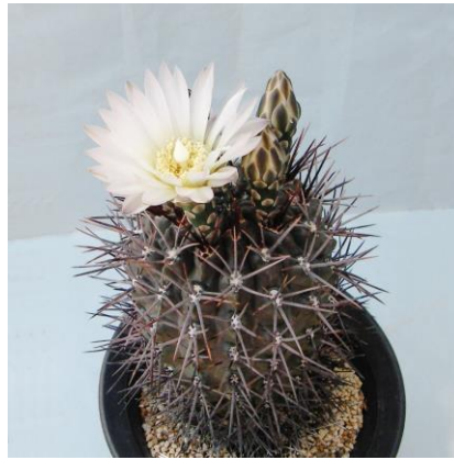
G. gibbosum v. nigrum (ニグラム)