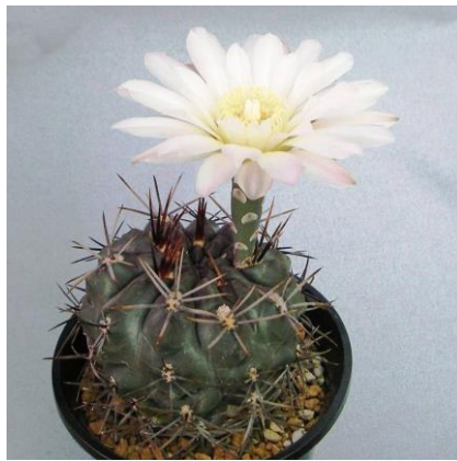
G. gibbosum v. nigrum Sa Lihuel Calel, La Pampa, Arg. (Piltz seed 0858)