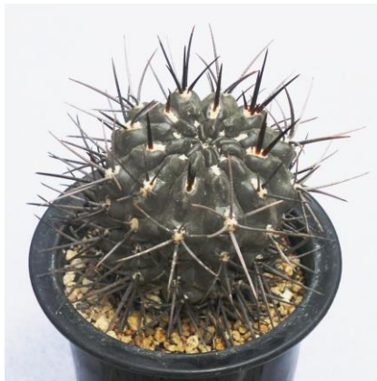
G. gibbosum v. nigrum (ニグラム)