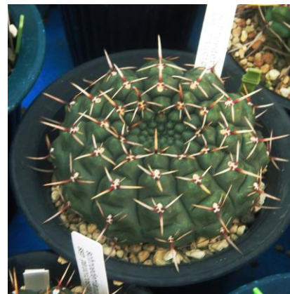
G. schroedrianum ssp. paucicostatum