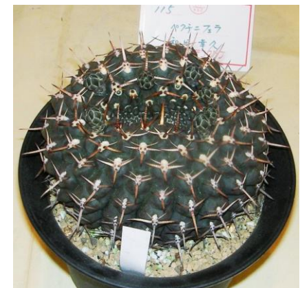
G. schroedrianum ssp. paucicostatum