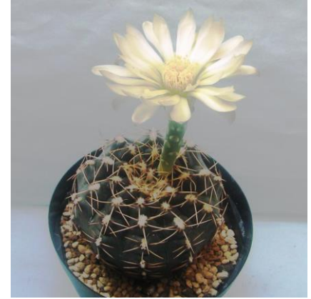
G. schroedrianum ssp. paucicostatum Monte Caseros, Corrientes, Arg. (Dhonalik seed DS-01156 )