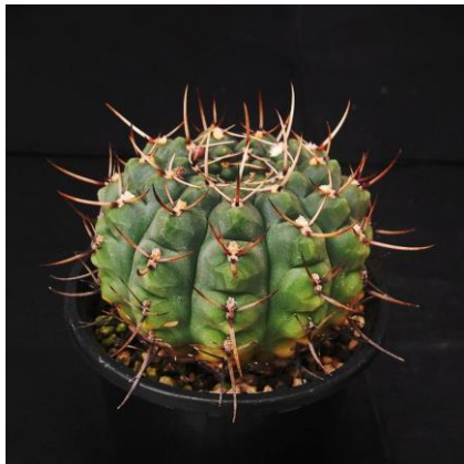
G. schroedrianum ssp. paucicostatum LB 960 Curuzu Cuatia, Corrientes, Arg. (Mesa seed 488.62)