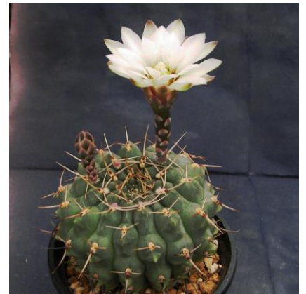
G. schroedrianum ssp. paucicostatum LB 960 Curuzu Cuatia, Corrientes, Arg. (Piltz seed 3142)