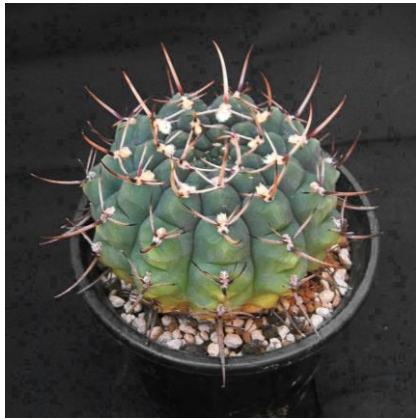
G. schroedrianum ssp. paucicostatum LB 960 Curuzu Cuatia, Corrientes, Arg. (Mesa seed 488.62)

Synonyms : \cong G. schroederianum ssp. schroederianum [G. Charles] : (シュロエデリアナム) (異名同種)