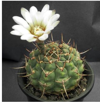
G. schroedrianum ssp. paucicostatum LB 960 Curuzu Cuatia, Corrientes, Arg. (Mesa seed 488.62)