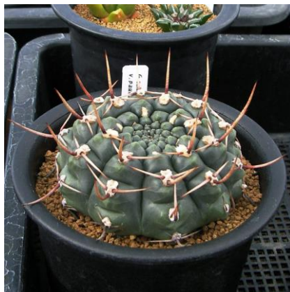
G. schroedrianum ssp. paucicostatum