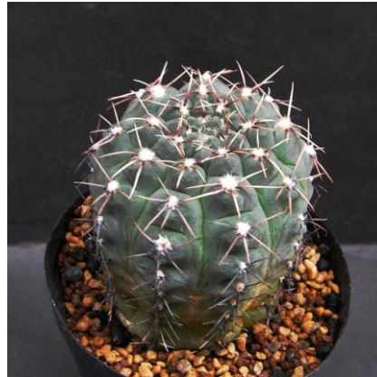
G. kieslingii f. castaneum P 220 Sanagasta, La Rioja, 1100m, Arg. (Mesa seed 469.4)