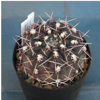
G. kieslingii f. castaneum VS 57 El Huaco, La Rioja, 1350m, Arg. (Mesa seed 469.44)