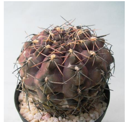
G. kieslingii f. castaneum VS 57 El Huaco, La Rioja, 1350m, Arg. (Mesa seed 469.44)