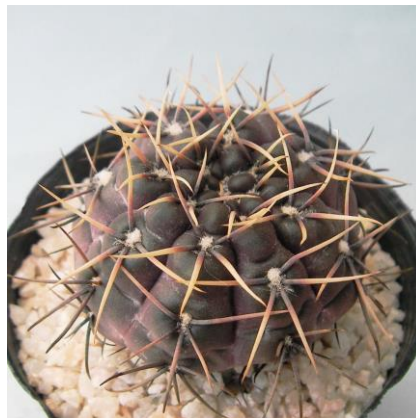
G. kieslingii f. castaneum VS 50 Anillaco, La Rioja, 1500m, Arg. (Mesa seed 469.42)