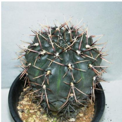
G. kieslingii f. castaneum VS 50 Anillaco, La Rioja, 1500m, Arg. (Mesa seed 469.42)