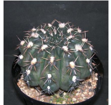
G. kieslingii f. castaneum P 220 Sanagasta, La Rioja, 1100m, Arg. (Mesa seed 469.4)