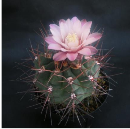
G. kroenleinii Sa. Malanzan, La Rioja, Arg. (Piltz seed 3943)

Synonyms : = G. kroenleinii [G. Charles] : ( ロエンレイニー ) (異名同種)