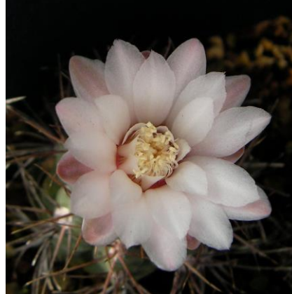
G. kroenleinii WR 805 Malanzan, La Rioja, Arg. (ex)Eden