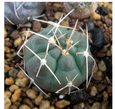
G. kroenleinii VG 508 El Playon, La Rioja, Arg. 1282 m (ex)Eden