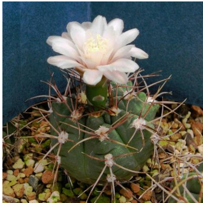
G. kroenleinii WR 805 Malanzan, La Rioja, Arg. (ex)Eden