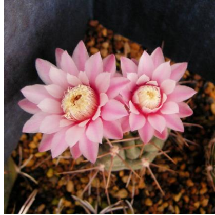
G. kroenleinii Sa. Malanzan, La Rioja, Arg. (Piltz seed 3943)