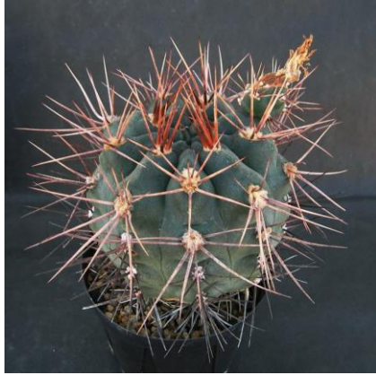
G. kroenleinii Sa. Malanzan, La Rioja, Arg. (Piltz seed 3943)

Synonyms : = G. kroenleinii [G. Charles] : ( ロエンレイニー ) (異名同種)