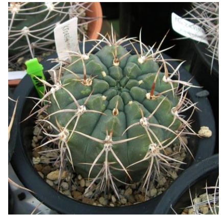
G. kroenleinii WR 805 Malanzan, La Rioja, Arg. (ex)Eden