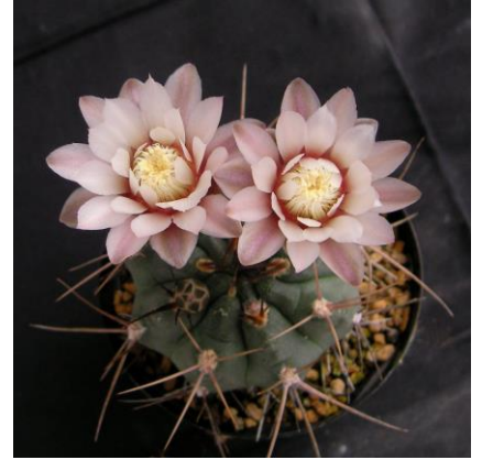
G. kroenleinii Sa. Malanzan, La Rioja, Arg. (Piltz seed 3943)