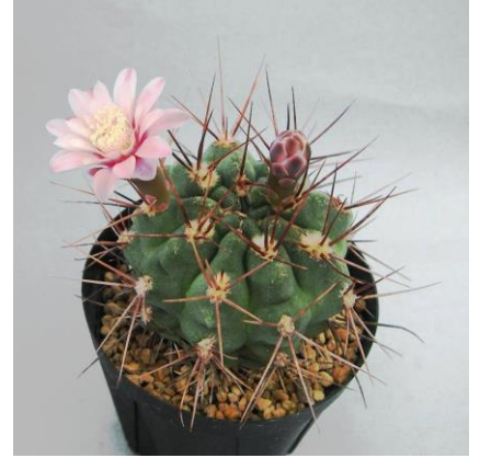
G. kroenleinii Sa. Malanzan, La Rioja, Arg. (Piltz seed 3943)