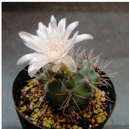
G. kroenleinii Tom 09-447 Sierra de Los Quinteros, Flialunbarr, La Rioja, Arg. (Kulhanek seed)