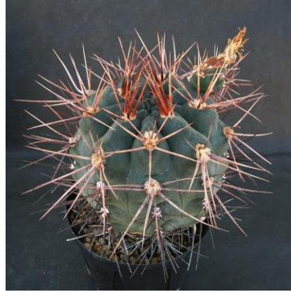
G. kroenleinii Sa. Malanzan, La Rioja, Arg. (Piltz seed 3943)