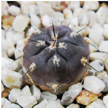
G. berchtii GN 158-418- Los Chanares, San Luis, Arg. (Piltz seed 3778)

Synonyms : ≒ G. berchtii [G. Charles] : (ベルクティー) (異名同種)