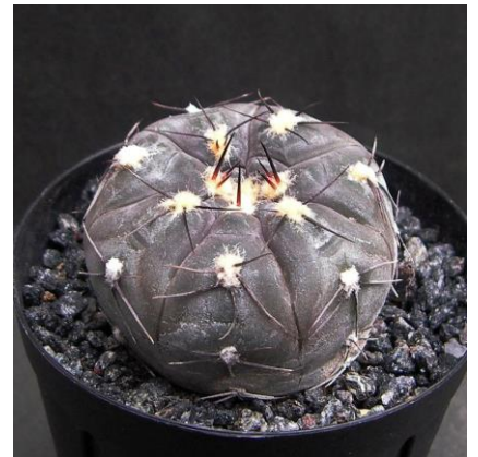
G. berchtii GN 158-418- Los Chanares, San Luis, Arg. (ex) Eden