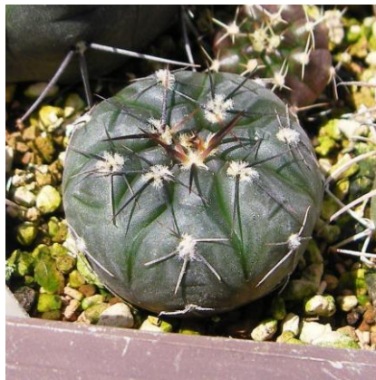
G. berchtii JO 1140.1 Los Chanares, San Luis, Arg. 300 m (ex) Eden