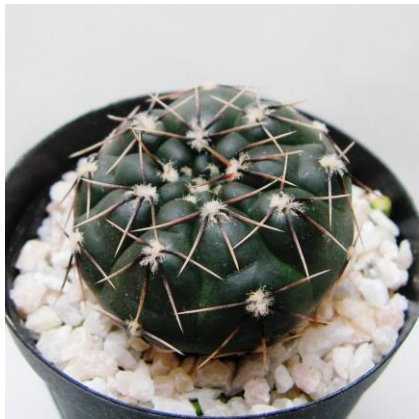
G. berchtii Tom 384.1 N of Santa Rosa del Conlara, R23, San Luis, Arg. 585m (ex) Eden