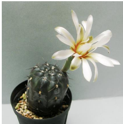
G. berchtii GN 158-418- Los Chanares, San Luis, Arg. (ex) Eden