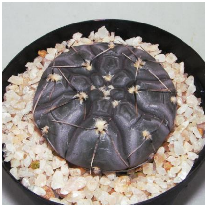
G. berchtii JO 787 Los Chanares, San Luis, Arg. (ex) Eden