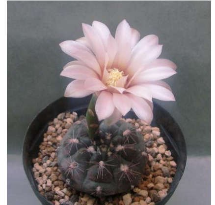
G. nataliae STO 526 Asticione de Fomento Ganadero, San Luis, Arg. (ex)Milenaudio