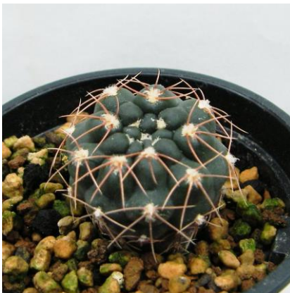
G. nataliae Tom 09-400-1c Pampa de San Martin, San Luis, Arg. (Kulhanek seed (2010))