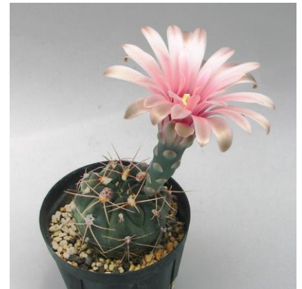
G. nataliae MM 650 route 2, near La Vertiente, San Luis Arg. (ex) Milenaudio