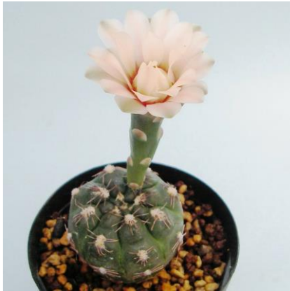
G. nataliae STO 526 Asticione de Fomento Ganadero, San Luis, Arg. (ex)Milenaudio

Synonyms \cong G. berchtii [G. Charles] : ( ベルクティエ )