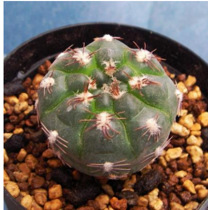
G. nataliae STO 526 Asticione de Fomento Ganadero, San Luis, Arg. (ex)Milenaudio