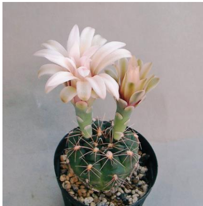
G. nataliae MM 743 Route 41, north Las Chacras, San Luis, Arg. (ex) Milenaudio