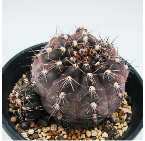
G. tanningaense STO 489-2 (タニンガエンセ)