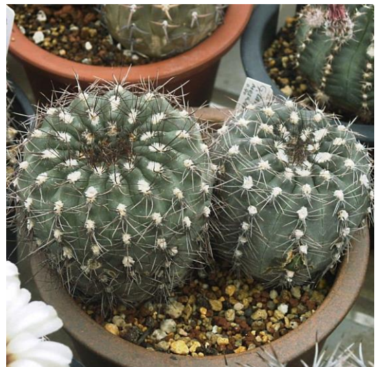
G. tanningaense (タニンガエンセ)