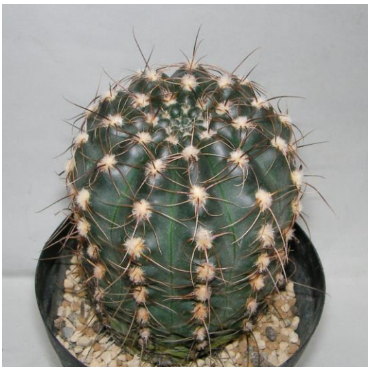
G. tanningaense JO 310 (タニンガエンセ)