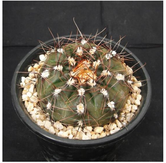
G. tanningaense P 212 (タニンガエンセ)