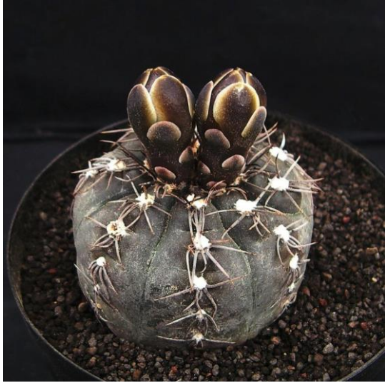
G. tanningaense STO 489-2 (タニンガエンセ)