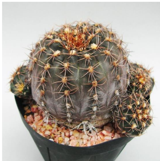
G. tanningaense STO 489-2 (タニンガエンセ)