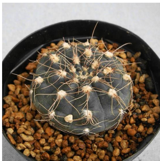
G. tanningaense JO 310 (タニンガエンセ)