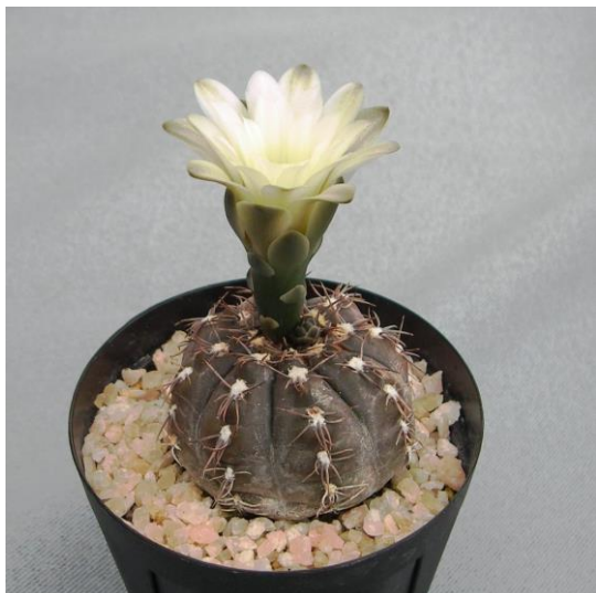
G. tanningaense STO 489-2 (タニンガエンセ)