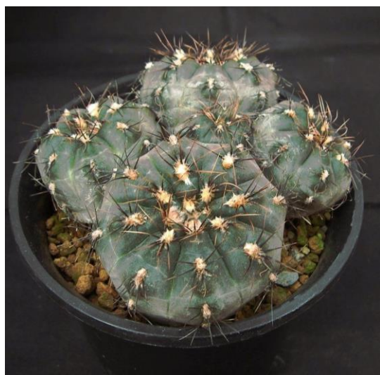
G. tanningaense P 212 (タニンガエンセ)