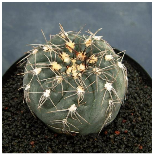
G. tanningaense STO 489-2 (タニンガエンセ)