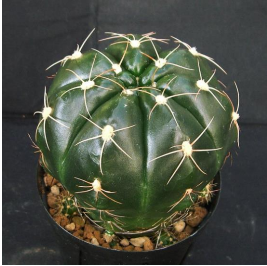
G. fleischerianum LB 021 ( 蛇紋玉 )