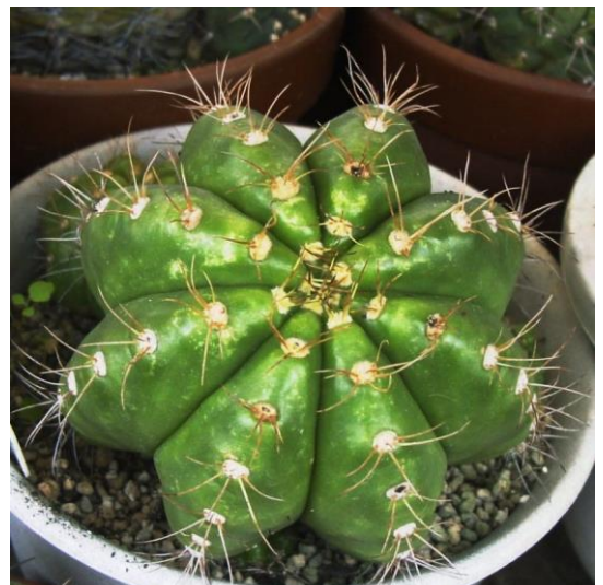
G. fleischerianum ( 蛇紋玉 )