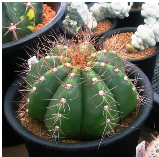
G. fleischerianum ( 蛇紋玉 )