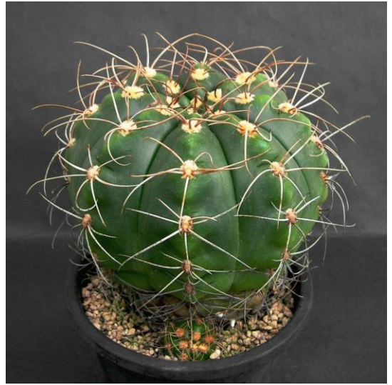
G. fleischerianum ( 蛇紋玉 )