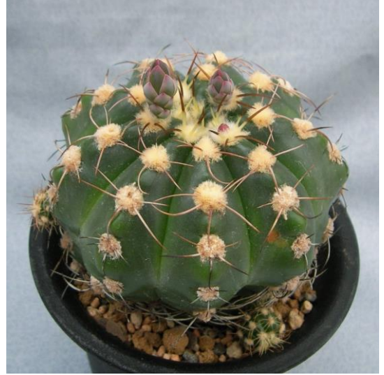
G. fleischerianum ( 蛇紋玉 )