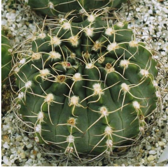
G. paraguayense aff. (モンビー玉 (竜卵))

Gymnocalycium paraguayense aff. : ( モンビー玉 (monbii-gyoku) )