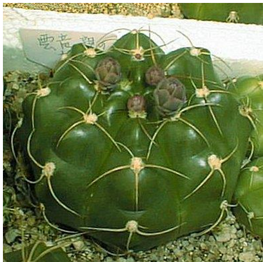
G. paraguayense aff. (モンビー玉 (雲竜))