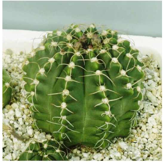
G. paraguayense aff. (モンビー玉 (雲竜))