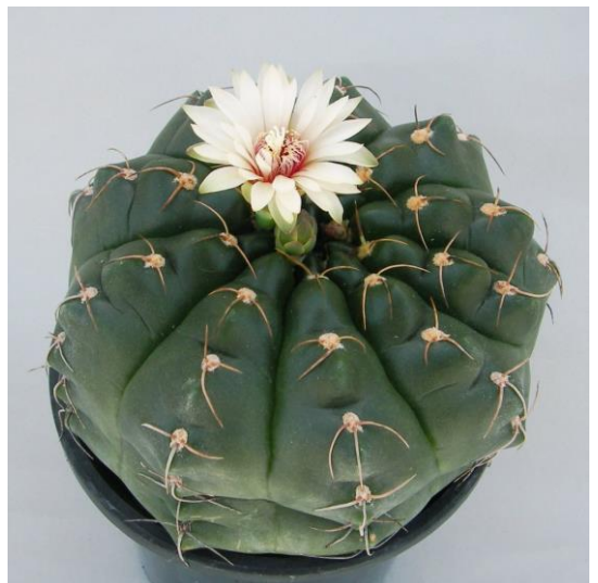
G. paraguayense aff. (モンビー玉 (雲竜))