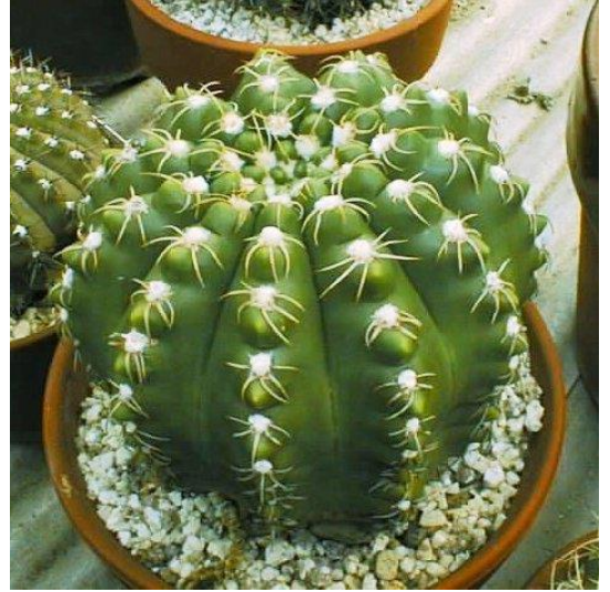
G. paraguayense aff. (モンビー玉 (竜卵))