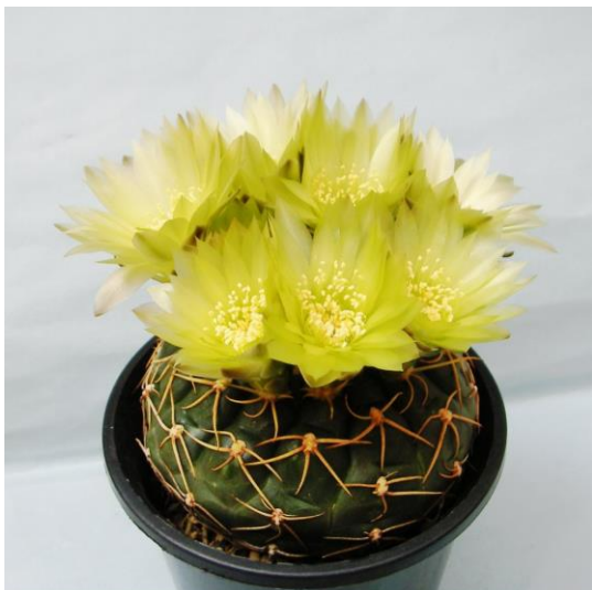
G. leeaum Schl 103 (リーアナム)