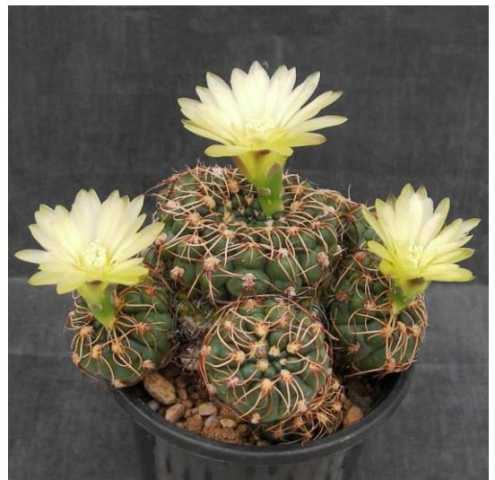
G. leeaum (夕勲丸)