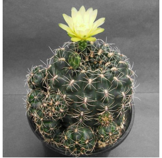
G. hyptiacanthum (ヒプティアカンサム)