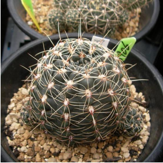
G. hyptiacanthum (ヒプティアカンサム)

Gymnocalycium leeanum (= G. hyptiacanthum ) : (リーアナム、 ヒプティアカンサム、 夕勲丸)