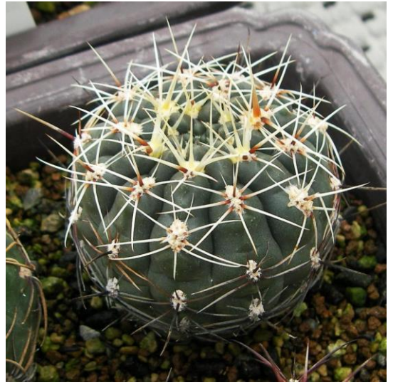
G. hyptiacanthum (ヒプティアカンサム)