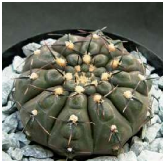
G. basiatrum P206 (バシアトラム)