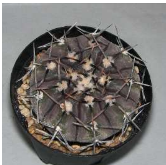
G. basiatrum P206 (バシアトラム)