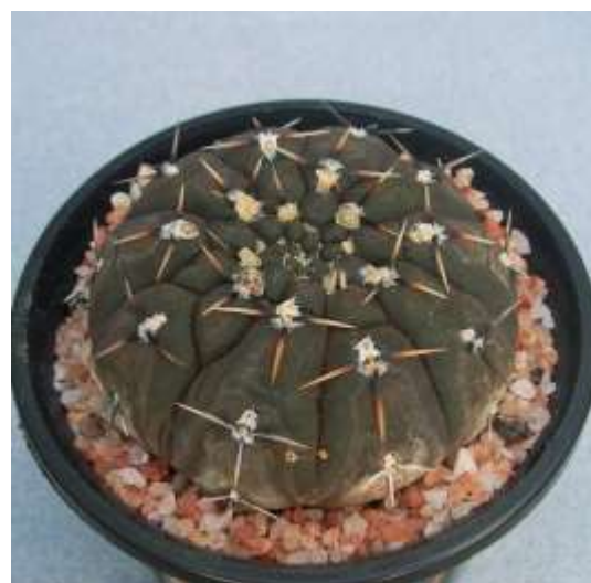
G. basiatrum P216 (バシアトラム)