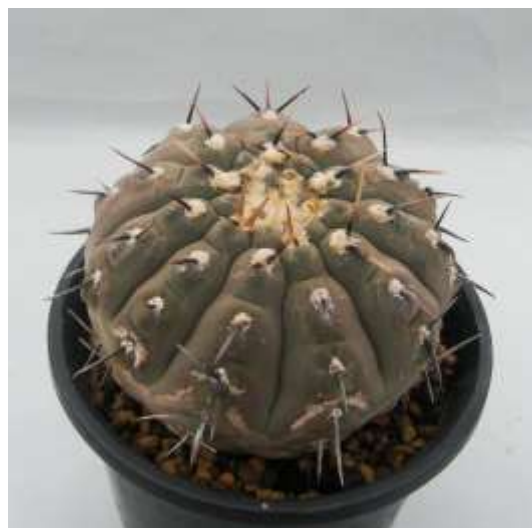
G. basiatrum P206 (バシアトラム)