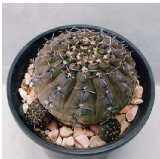
G. basiatrum P216 (バシアトラム)