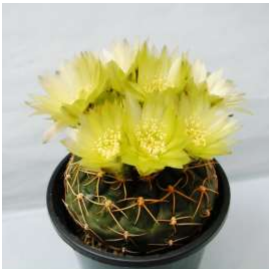
G. leeaum Schl 103 (リーアナム)