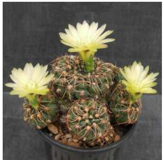
G. leeaum (夕勲丸)