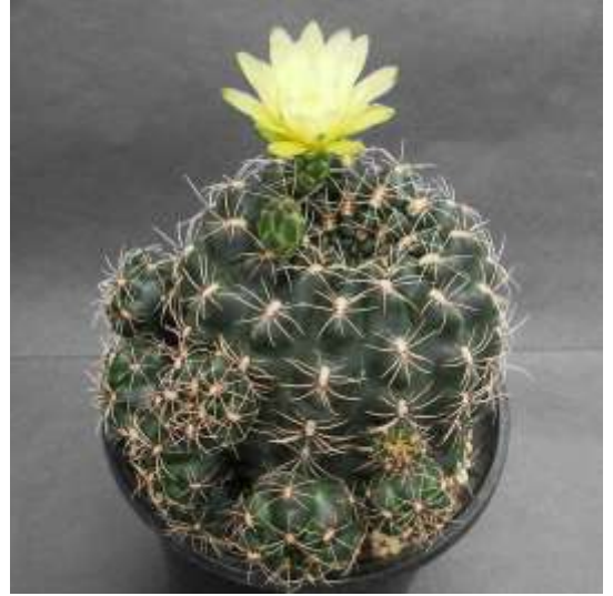
G. hyptiacanthum (ヒプティアカンサム)