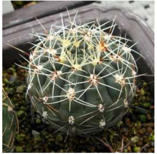
G. hyptiacanthum (ヒプティアカンサム)