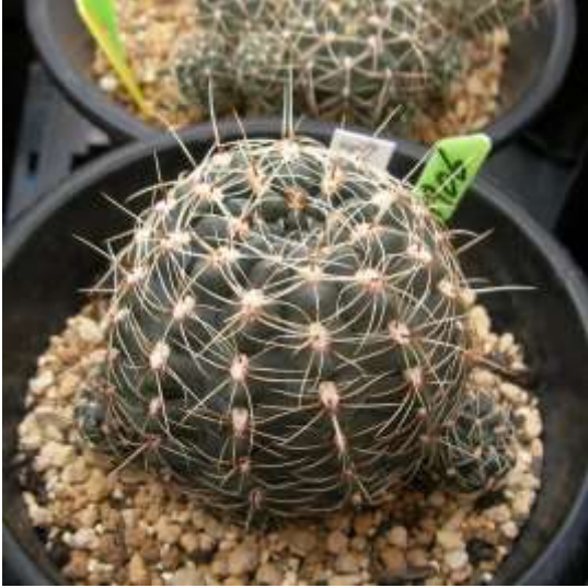
G. hyptiacanthum (ヒプティアカンサム)

Gymnocalycium leeanum (= G. hyptiacanthum ) : (リーアナム、 ヒプティアカンサム、 夕勲丸)