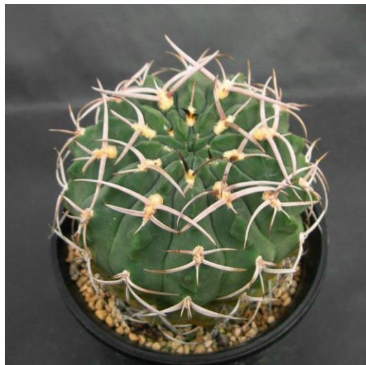
G. catamarcense f. ensispinum OF 27-80 (エンシスピナム)