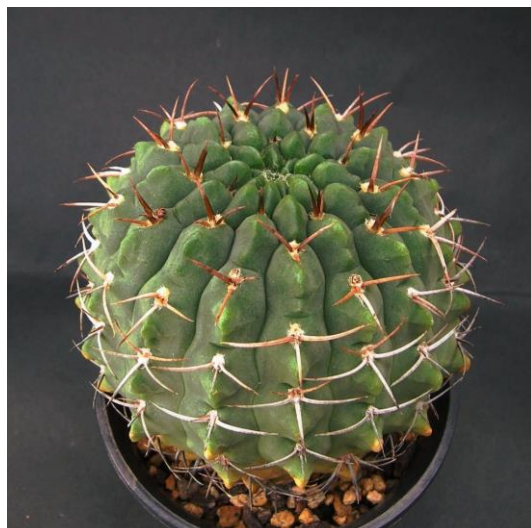
G. catamarcense f. ensispinum STO 135-5 (エンシスピナム)