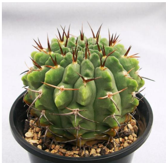
G. catamarcense f. ensispinum STO 135-5 (エンシスピナム)