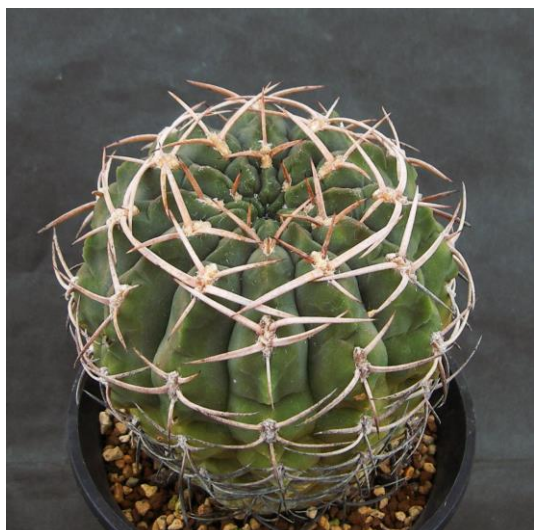
G. catamarcense f. ensispinum OF 27-80 (エンシスピナム)