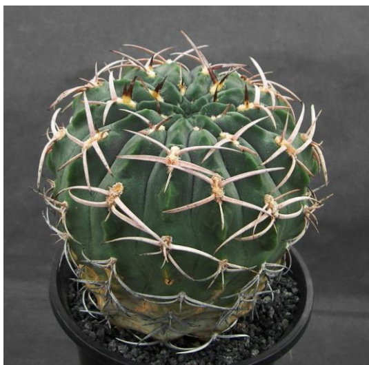
G. catamarcense f. ensispinum OF 27-80 (エンシスピナム)