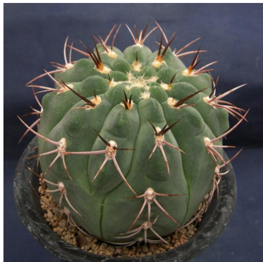
G. catamarcense f. montanum P 73B (モンタナム)