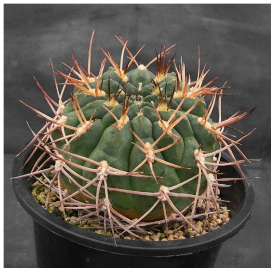
G. catamarcense ssp. acinacispinum STO 45 (アキナキスピナム)