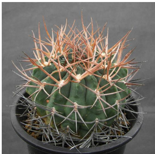
G. catamarcense ssp. acinacispinum STO 45 (アキナキスピナム)

Gymnocalycium catamarcense f. montanum : (カタマルケンセ (品種) モンタナム)