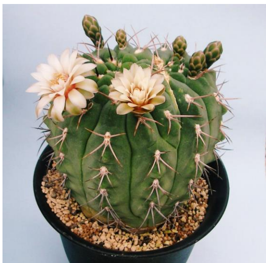
G. catamarcense f. montanum P 73B (モンタナム)