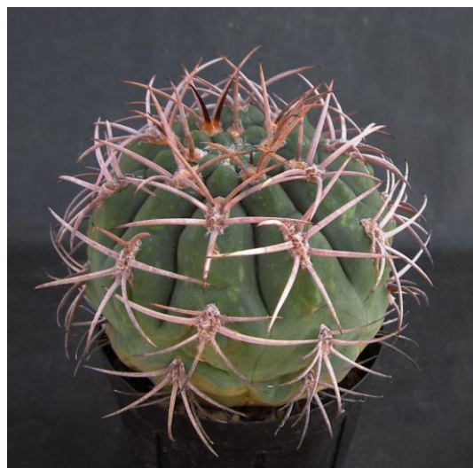
G. catamarcense f. montanum JO 818.1 (モンタナム)