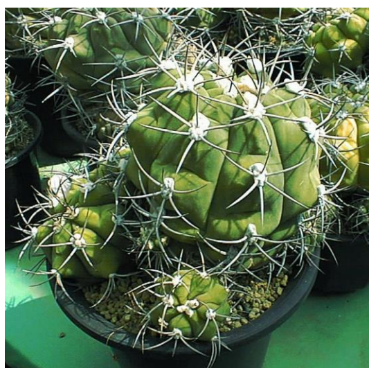
G. pflanzii varieg. (天賜玉(墨斑))