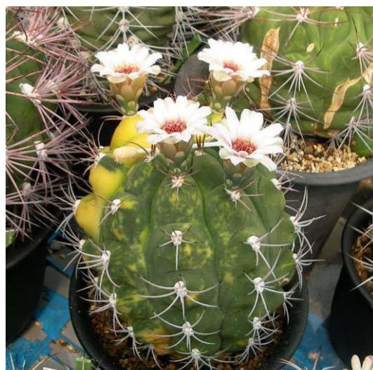
G. pflanzii varieg. (天賜玉錦)