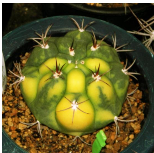
G. pflanzii varieg. (天賜玉錦)