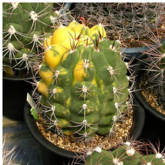
G. pflanzii varieg. (天賜玉錦)