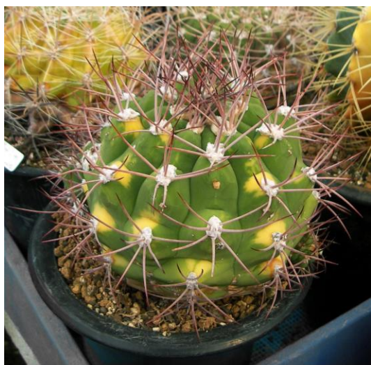
G. pflanzii varieg. (天賜玉錦)