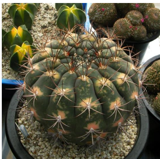
G. pflanzii v. albipulpa varieg. (天紫錦)