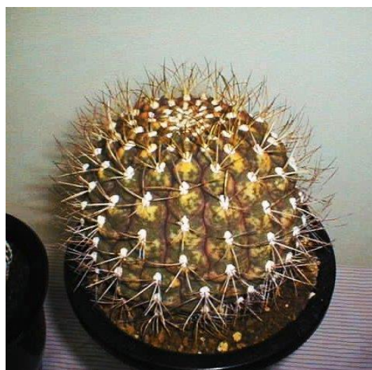
G. pflanzii v. albipulpa varieg. (天紫錦)