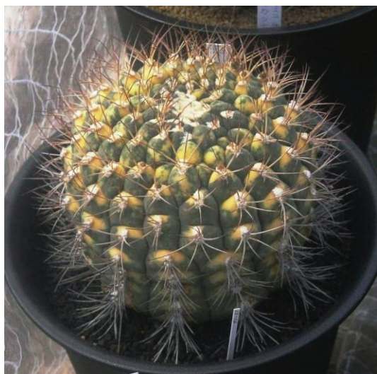
G. pflanzii v. albipulpa varieg. (天紫錦)

Gymnocalycium zegarrae varieg. (= G. pflanzii v. albipulpa varieg.): (天紫錦、尾形錦)