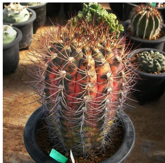
G. pflanzii v. albipulpa varieg. (天紫錦)