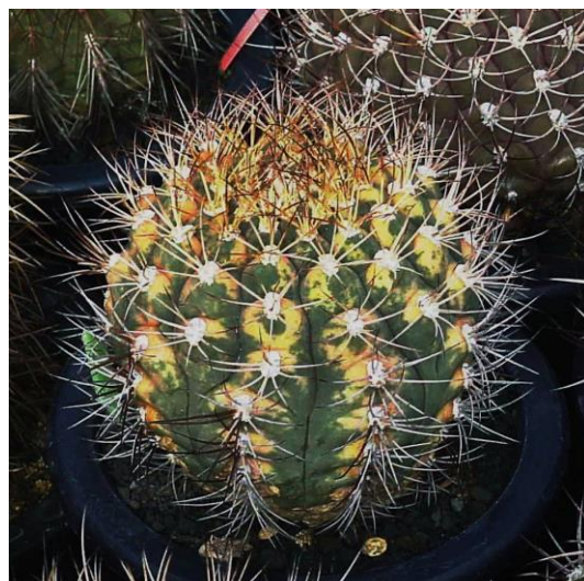
G. pflanzii v. albipulpa varieg. (天紫錦)