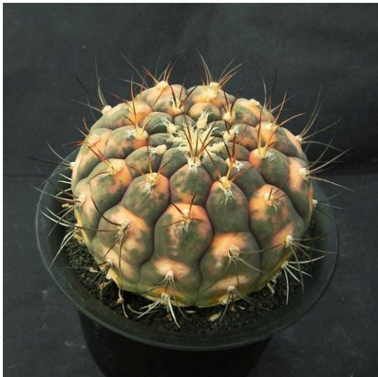
G. pflanzii v. albipulpa varieg. (天紫錦)