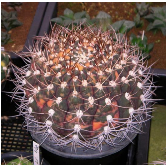
G. pflanzii v. albipulpa varieg. (天紫錦)