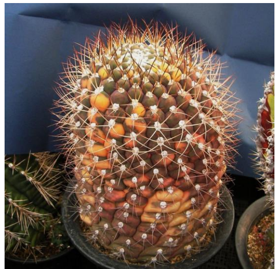
G. pflanzii v. albipulpa varieg. (天紫錦)