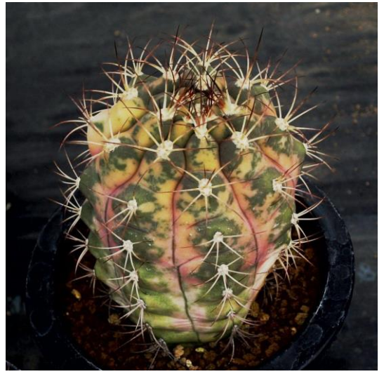
G. pflanzii v. albipulpa varieg. (天紫錦)