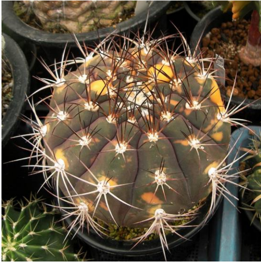
G. pflanzii v. albipulpa varieg. (天紫錦)

Gymnocalycium zegarrae varieg. (= G. pflanzii v. albipulpa varieg.): (天紫錦、尾形錦)