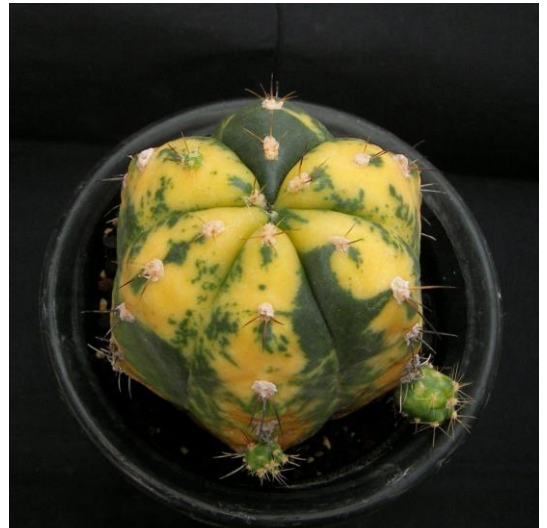
G. buenekeri varieg. (聖王錦)