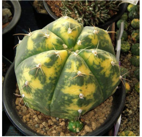
G. buenekeri varieg. (聖王錦)