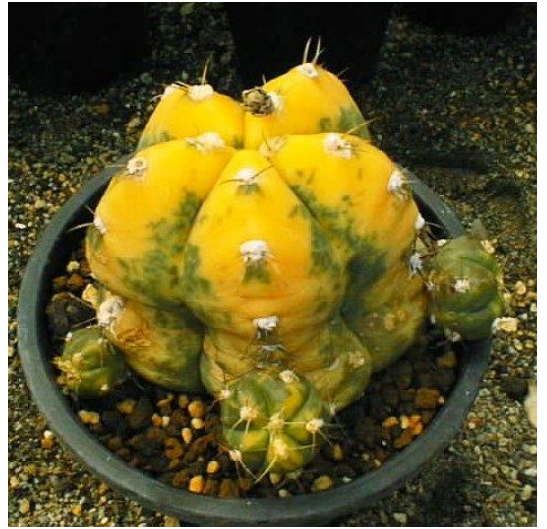
G. buenekeri varieg. (聖王錦)