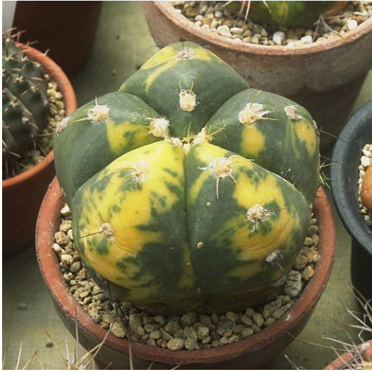
G. buenekeri varieg. (聖王錦)