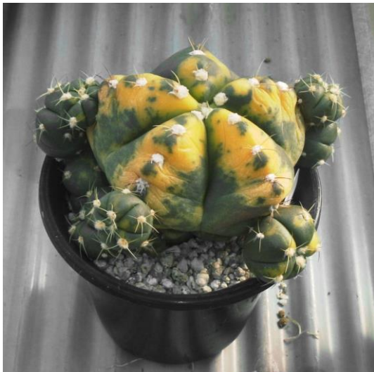
G. buenekeri varieg. (聖王錦)