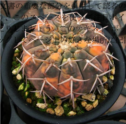
G. bodenbenderianum varieg. (守殿錦)

[文書の重要な部分を引用して読者の注意を引いたり、このスペースを使う注目ポイントを強調したりしましょう。このテキストボックスは、ドラッグしてページ上の好きな場所に配置できます。]