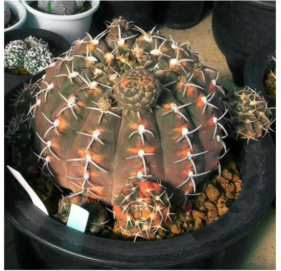
G. bodenbenderianum varieg. (守殿錦)

[文書の重要な部分を引用して読者の注意を引いたり、このスペースを使う注目ポイントを強調したりしましょう。このテキストボックスは、ドラッグしてページ上の好きな場所に配置できます。]