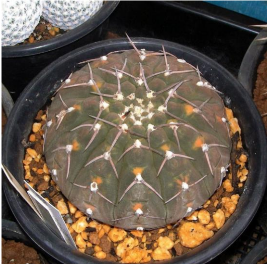
G. bodenbenderianum varieg. (守殿錦)