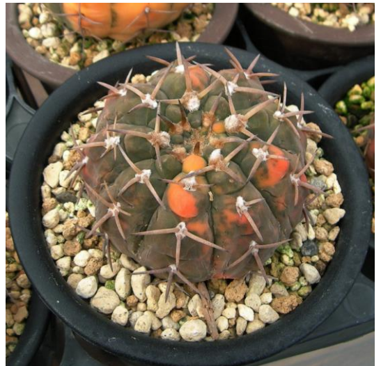
G. bodenbenderianum varieg. (守殿錦)