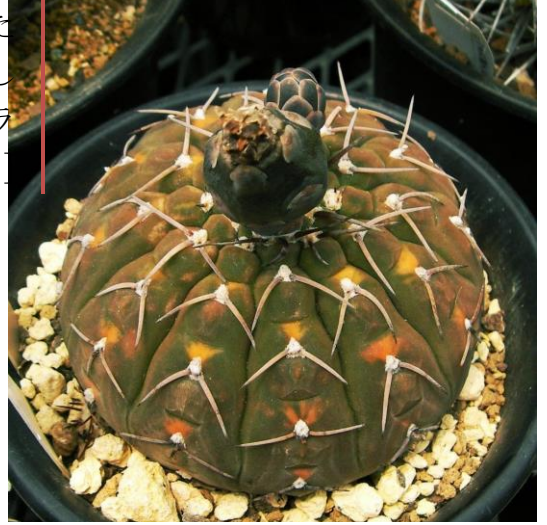
G. bodenbenderianum varieg. (守殿錦)